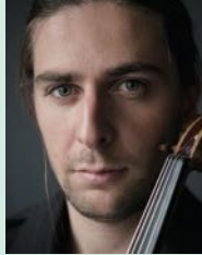
ジュリアン・ズルマン