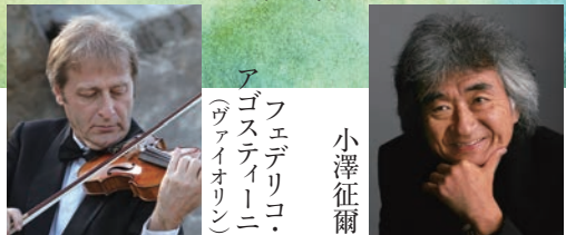
アゴステイロニ (ヴァイオリン)